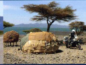
PISTE DU NORD KENYA