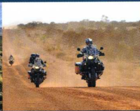
GREAT VICTORIA HIGHWAY